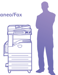
WorkCentre 5230 con módulo de dos bandejas

25,2" x 25,7" x 43,8" 640 x 652 x 1113 mm